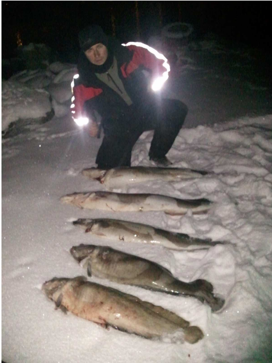
Skitt fiske 2011