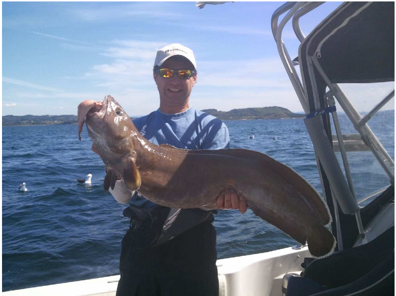
Ny klubbrekord 11,1 kg :o)