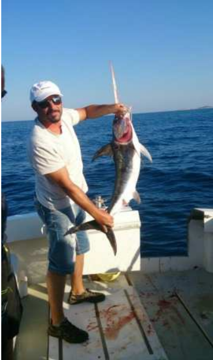
Matè – Guiden vår