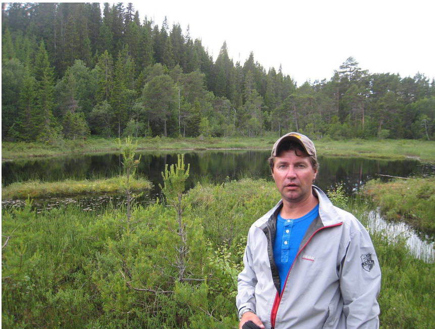
"Vannet" eller pytten

Neste dag skulle vi ut på havet etter blåkjeft mm. Ut i broderen sin 9 fots gummi jolle med 6hk Tohatsu på. Rigget med hver sin stang og han hadde jaggu meg fått seg ekkolodd i denne "båten"også.