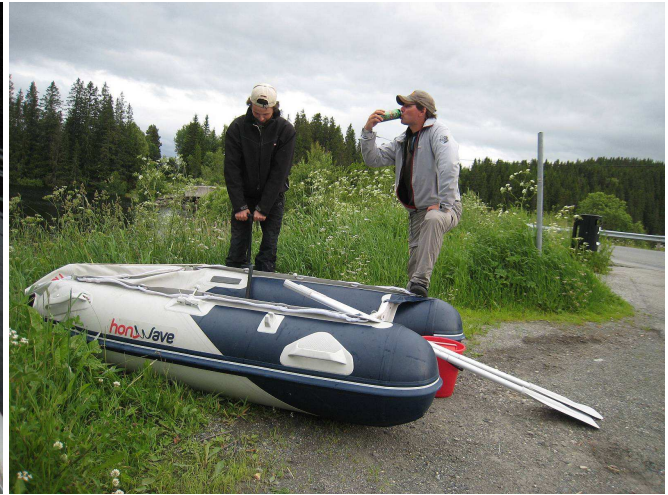
Her sliter jeg meg ut :o)